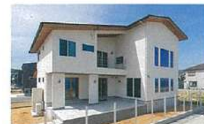
地盤調査も行い頑丈なベタ基礎を採用

全棟に許容応力度計算を実施し、耐久性の高い構造材や接合金物を使用。剛床構造で強度を高め、制震ダンパーで揺れを吸収。耐震・制震性に優れた構造も魅力のひとつ。