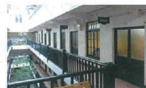
同社オフィスが入る船場ビルディング

同社のオフィスは、各線「淀屋橋」駅から徒歩圏内。デザイン事務所や雑貨店などが軒を連ねるノスタルジックな雰囲気のビルの一室でゆったり打ち合わせができる。