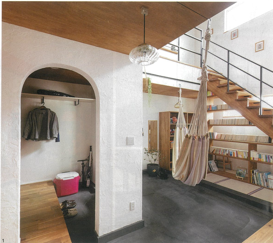
1 / 広い土間やアーチ型の開口、造り付けの本棚にこだわった開放的な玄関。壁の漆喰や床のモルタルは1さんの友人やkicoriのスタッフと一緒に塗装した 2 / 床はアカシアの無垢フローリング。アイアンの手すりや木にオイル塗装をした天井、木枠の室内窓も良い雰囲気 3 / 木のカウンターに真鍮の水栓やタイルを合わせて製作した洗面化粧台