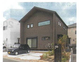
植栽豊かな枕木のアプローチを抜けた先が玄関。濃茶の壁や三角屋根が印象的な外観