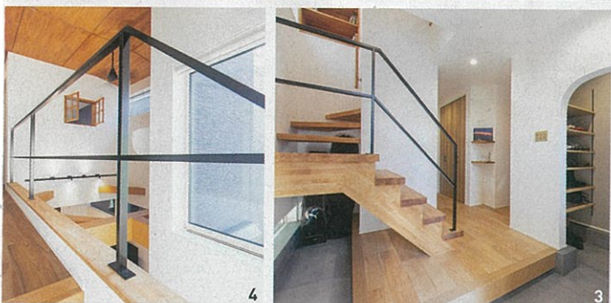
1 / 四方を家に囲まれた旗竿地に建つ住まい。採光を優先して2階に配置したLDKは対面キッチンやワークスペースを備えた吹き抜けの大空間 2 / 1階から3階まで木製のスリット階段で緩やかに繋がる開放的な住まい 3 / L型の広い土間が印象的な玄関 4 / 南に配した大きな窓から光が注ぎ、この明るさ