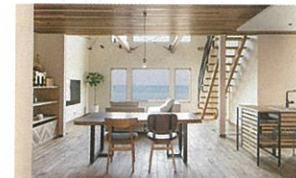
スケルトン階段や大きな吹き抜けも可能

許容応力度計算を実施し、制振ダンパーを標準装備。ダブル断熱も採用可能で、高効率熱交換型換気システムも搭載。耐震・制震、断熱・気密・換気にもこだわっている。