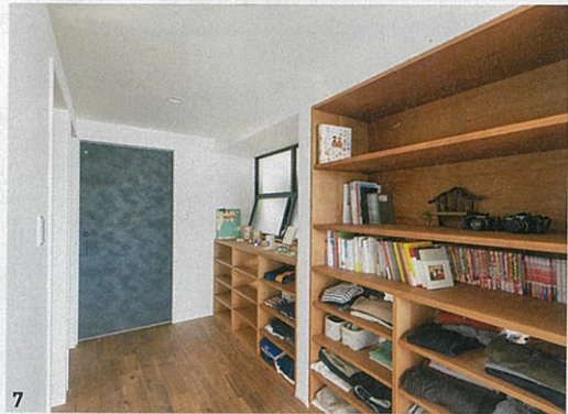
4 / 木のカウンターに真鍮の水栓やモザイクタイルを合わせて制作した洗面化粧台 5 / リビングのベンチやキッチンカウンター、カップボードなど、木の造作が魅力的LDK 6 / 床は深い色味が特徴のアカシアの無垢フローリング。アイアンの手すりや木にオイル塗装をした天井、木枠の室内窓も美しい雰囲気 7 / 2階は収納が豊富。アイアンの窓の裏は室内干しができるサンルームになっており、片付けた衣類が廊下側からも取り出せるよう工夫されている