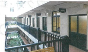
同社オフィスが入る船場ビルディング

同社のオフィスは、各線「淀屋橋」駅から徒歩圏内。デザイン事務所や雑貨店などが軒を連ねるノスタルジックな雰囲気のビルの一室でゆったり打ち合わせができる。