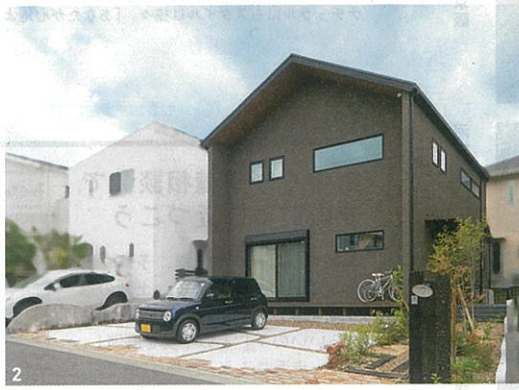
1 / 広い土間やアーチ型の開口、造り付けの本棚にこだわった開放的な玄関。壁の漆喰や床のモルタルは1さんの友人やkicoriのスタッフと一緒にDIYで塗装した 2 / 濃茶の外壁が印象的な三角屋根の外観 3 / ハンモックに揺られながら読書をしたり、昼寝をしたり。家全体が吹き抜けて繋がっている（見開きの写真はすべて大阪府氏邸）