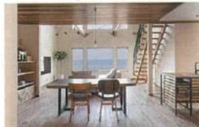
スケルトン階段や大きな吹き抜けも可能

許容応力度計算を実施し、制振ダンパーを標準装備。ダブル断熱も採用可能で、高効率熱交換型換気システムも搭載。耐震・制震、断熱・気密・換気にもこだわっている。