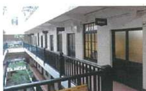
同社オフィスが入る船場ビルディング

同社のオフィスは、各線「淀屋橋」駅から徒歩圏内。デザイン事務所や雑貨店などが軒を連ねるノスタルジックな雰囲気のビルの一室でゆったり打ち合わせができる。