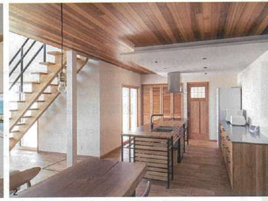
1/大きなカウチソファがゆったりとレイアウトできる吹き抜けのリビングに大勢で食事が楽しめるゆとりのあるダイニング、すぐ先に砂浜が広がるリゾート感溢れる住まい 2/海を眺めながら優雅に料理。天板にステンレスをあしらったアイアンフレームの木製キッチンオープンレイアウト（見開きの写真はすべて兵庫県K氏邸）