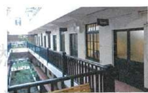
同社オフィスが入る船場ビルディング

同社のオフィスは、各線「淀屋橋」駅から徒歩圏内。デザイン事務所や雑貨店などが軒を運ぶノスタルジックな雰囲気のビルの一室でゆとり打ち合わせができる。