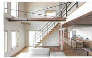
スケルトン階段や大きな吹き抜けも可能

許容応力度計算を実施し、制振ダンパーを標準装備。ダブル断熱も採用可能で、高効率熱交換型換気システムも搭載。耐震・制震、断熱・気密・換気にもこだわっている。