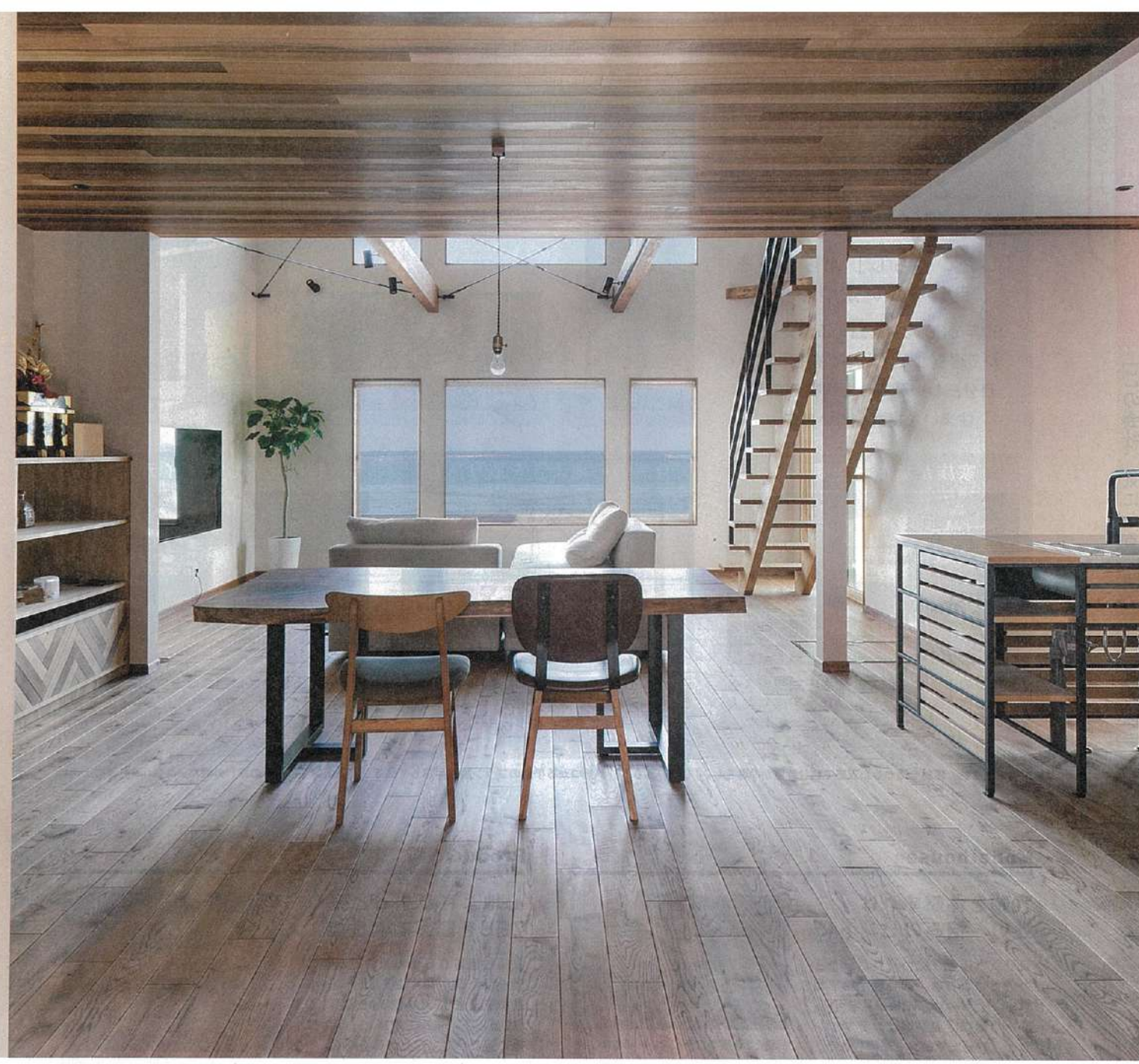
玄関のドアを開けるとこの開放感。視線を外に抜けるよう設計されており、海と空の配分なども計算しながら窓の仕様を決めていった（見開きの写真はすべて兵庫県K氏邸）