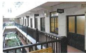
同社オフィスが入る船場ビルディング

同社のオフィスは、各線「淀屋橋」 駅から徒歩圏内。デザイン事務所 や雑貨店などが軒を連ねるノスタ ルジックな雰囲気のビルの一室で ゆったり打ち合わせができる。