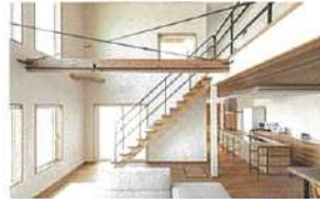
スケルトン階段や大きな吹き抜けも可能

許容応力度計算を実施し、制振ダ ンパーを標準装備。ダブル断熱も 採用可能で、高効率熱交換型換気 システムも搭載。耐震・制震、断熱・ 気密・換気にもこだわっている。