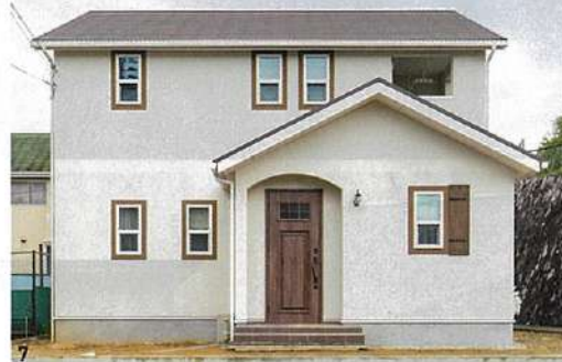
2/LDK内には子どもたちのスタディールームやランドリースペースも 3/ダイニングの壁には、星や月、雲をモチーフにしたキャットウォーク 4/キッチンの横にはパントリーがあり、その奥には夫の書斎 5/リビングの吹き抜けにも2匹の猫の通り道。板張りの天井や木製の小窓もイメージにぴったり 6/土間収納を備えた広い玄関。リビングドアはオリジナルで製作した 7/アーチ型の開口や木製の玄関ドア、白いフレームの上げ下げ窓が印象的な外観