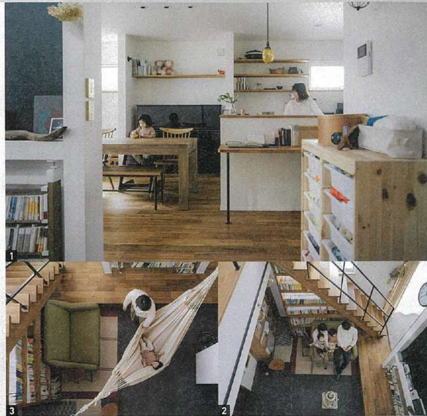
若い世代からの依頼が多く、子育て仕様の住まいを多数提案。たくさんある引き出しの中から家族に適したプランを案内してくれる（このページの写真は大阪府M氏邸）