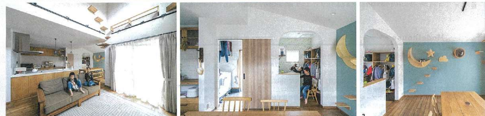
1/無垢フローリングに塗喰壁、キッチンの床はタイルで仕上げ、背面にはオリジナルで製作したカップボードも。ナチュラルスタイルのインテリアが馴染むLDK 2・3/LDK内には子どもたちのスタディールームやランドリースペース、キャットウォークも 4/家族みんなで寛げる吹き抜けのリビング（このページの写真は大阪府M氏邸）