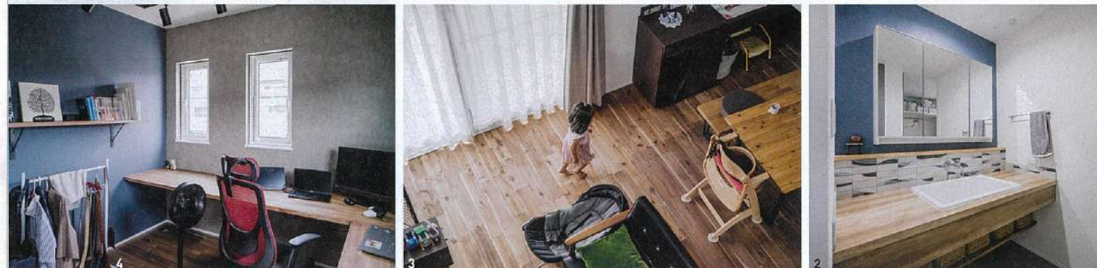
1/規格住宅「kicori select」で建てた住まい。無垢フローリングの床に塗り壁調の壁を合わせてグレーのクロスでアクセント。対面式のキッチンを備えた開放的なDK 2/洗面化粧台はオリジナルで製作 3/家のどこにおいても家族の気配が感じられる 4/ネイビーとグレーでシックにまとめた夫の書斎 (このページの写真は兵庫県M氏邸)