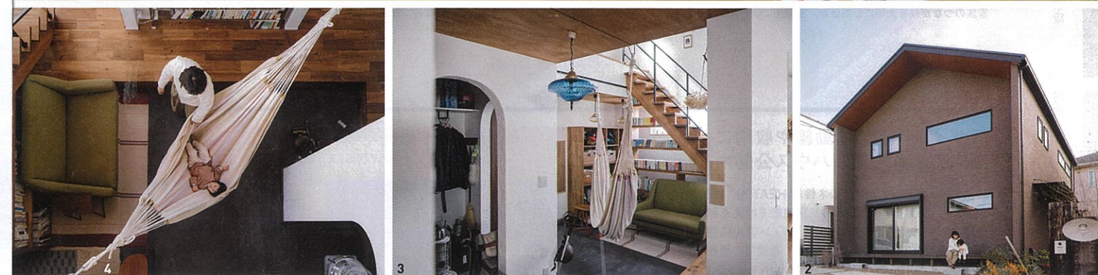
1/空間全体が見渡せるようキッチンを対面型に配置。好きな雑貨や調理道具を飾って楽しめる木のオープンラックも魅力的 2/ブラウンの壁と三角屋根の組み合わせが美しい外観 3・4/ハンモックを吊るせる広い土間やアーチ型の開口、階段の下に造り付けた本棚など、こだわりが詰まった吹き抜けの玄関(このページの写真は大阪府I氏邸)