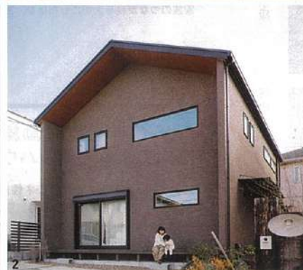
1/空間全体が見渡せるようキッチンを対面型に配置。好きな雑貨や調理道具を飾って楽しめる木のオープンラックも魅力的 2/ブラウンの壁と三角屋根の組み合わせが美しい外観 3・4/ハンモックを吊るせる広い土間やアーチ型の開口、階段の下に造り付けた本棚など、こだわりが詰まった吹き抜けの玄関(このページの写真は大阪府I氏邸)