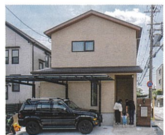
アースカーでまとめた三角屋根の優しい外観。板張りの門柱もイメージにぴったり