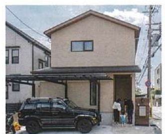
アースカラーでまとめた三角屋根の優しい外観。板張りの門柱もイメージにぴったり